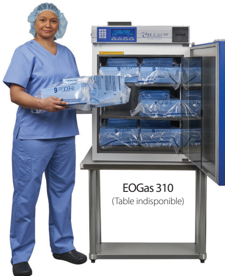
EOGas 310 (Table indisponible)